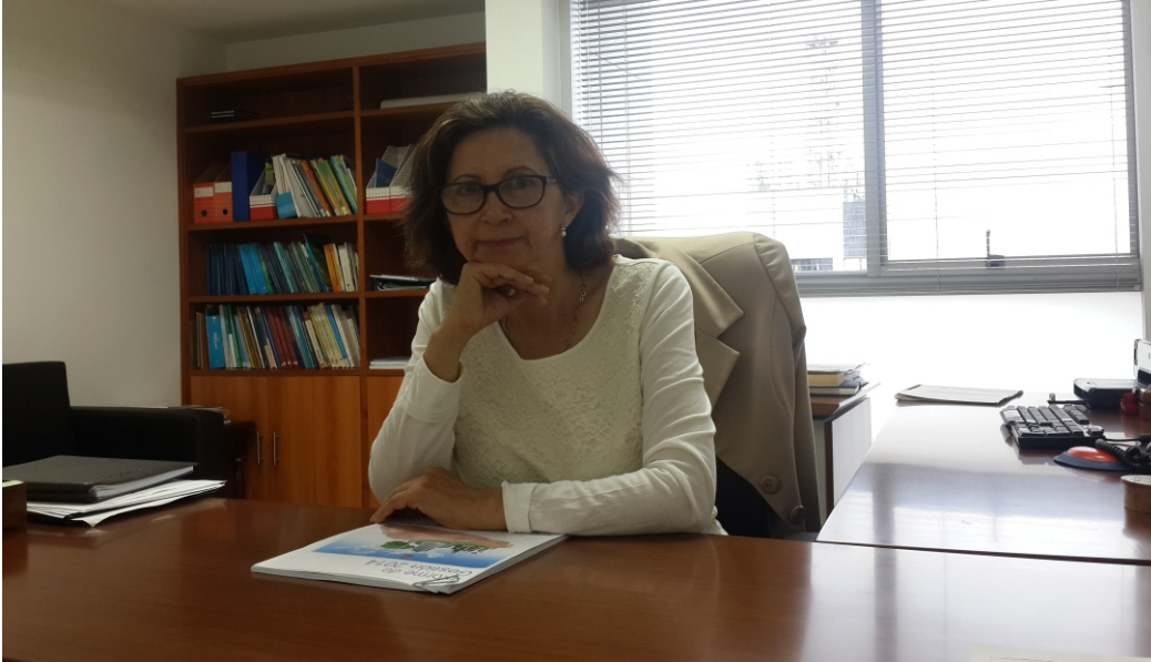
Magistrada Flor Eucaris Díaz Buitrago, Presidenta de la Sala Administrativa del Consejo Seccional de la Judicatura de Caldas.

A cercar aún más la justicia al ciudadano, fortalecer las políticas de calidad enfocadas al usuario, no desfallecer en la gestión de recursos e intensificar el trabajo mancomunado hacia la no discriminación de género, son solo algunas de las políticas de la Sala Administrativa del Consejo Seccional de la Judicatura de Caldas para este 2015.