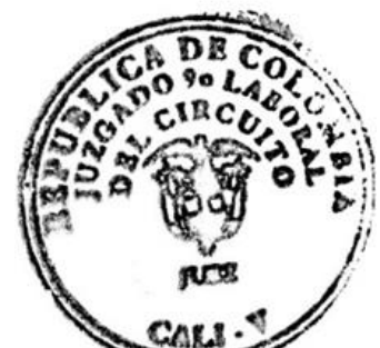
LIGIA MERCEDES MEDINA BLANCO